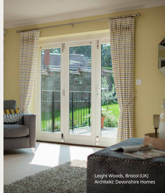
Leight Woods, Bristol (UK) Architekt: Devonshire Homes

Die Wärmeverluste werden reduziert und somit Heizkosten eingespart. Weiterhin trägt SWISSPACER ADVANCE zu einem erhöhten Wohnkomfort im Gebäude bei, denn die Temperaturen am Glasrand bleiben hoch. Die Gefahr von Tauwasserbildung und von Schimmelbefall wird vermieden.